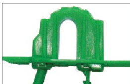
I - Правильное замыкание В арке видны маленькие зубцы гибкого элемента.