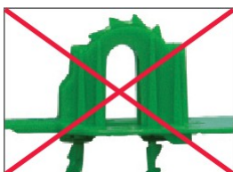
II - Неправильное замыкание В арке видны большие зубцы.